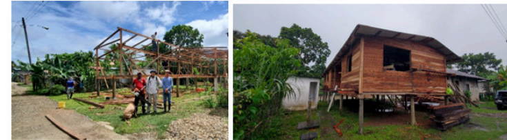
<PinoGana 마을 단기선교팀 숙소공사>