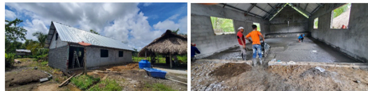
<La Palmera 은혜교회 건축>

하나님의 은혜와 성도님들의 기도로 조금씩 건축해 나가고 있습니다. 끝까지 잘 완공할 수 있도록 기도 부탁드립니다